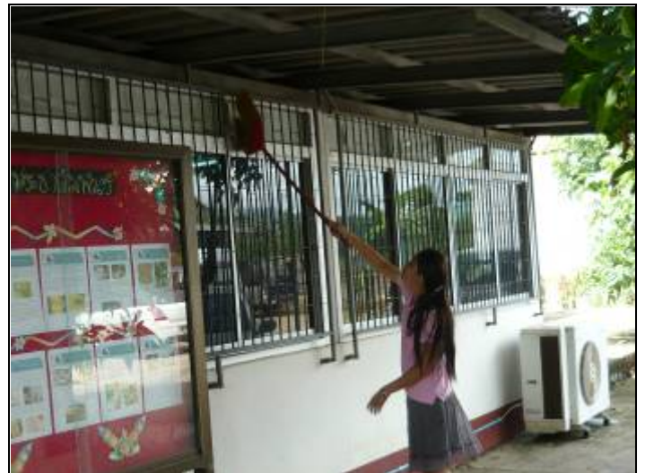
ทำความสะอาด ดูดฝุ่น และจัดระเบียบอุปกรณ์สำนักงานต่างๆ