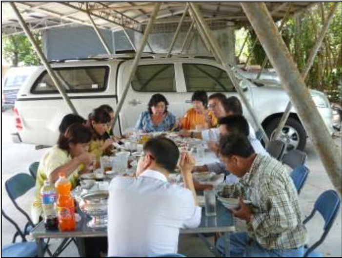
จัดให้มีการทำอาหารรับประทานร่วมกัน เพื่อความสามัคคีในหมู่คณะ