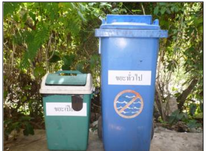
ปรับปรุงภูมิทัศน์หน้าอาคารสำนักงาน จัดหาถังขยะที่มีฝาปิดมิดชิด