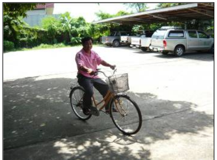
จัดบอร์ดสำหรับให้ความรู้ด้านสุขภาพ เจ้าหน้าที่มีการออกกำลังกา