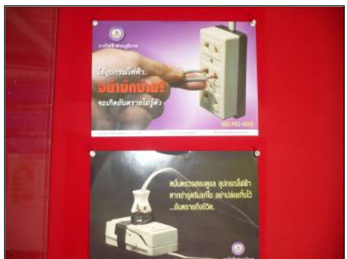
จัดเวรยามให้เจ้าหน้าที่ดูแลความปลอดภัยให้แก่สำนักงาน และจัดบอร์ดให้ความรู้ด้านความปลอดภัยเกี่ยวกับการใช้งานเครื่องใช้ไฟฟ้า