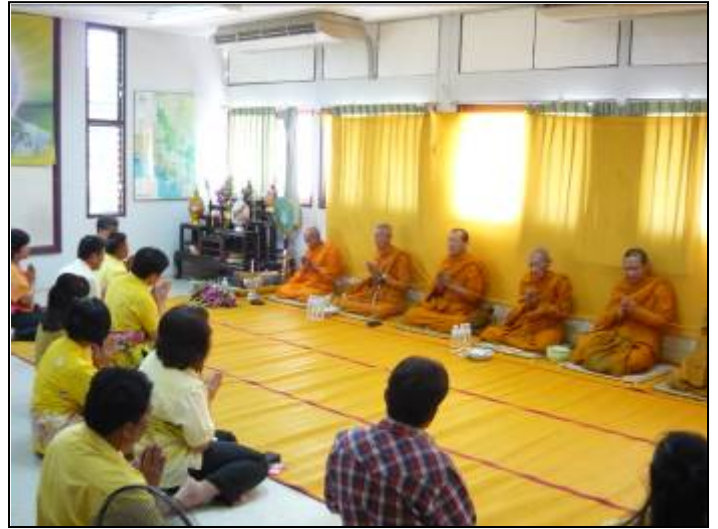
จัดให้มีการทำบุญประจำปี เพื่อให้เกิดความเป็นสิริมงคลแก่ข้าราชการ พนักงานราชการ และลูกจ้างประจำ