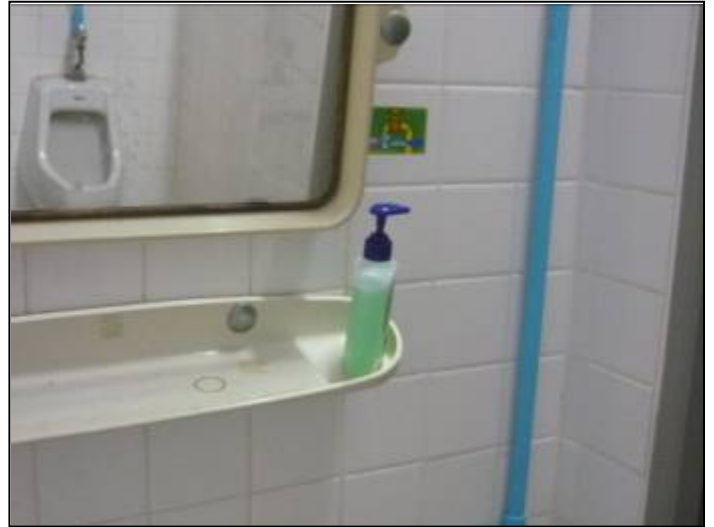
กำหนดหน้าที่ความรับผิดชอบของเจ้าหน้าที่ จัดอุปกรณ์เครื่องใช้ในห้องน้ำเพื่อความสะดวก