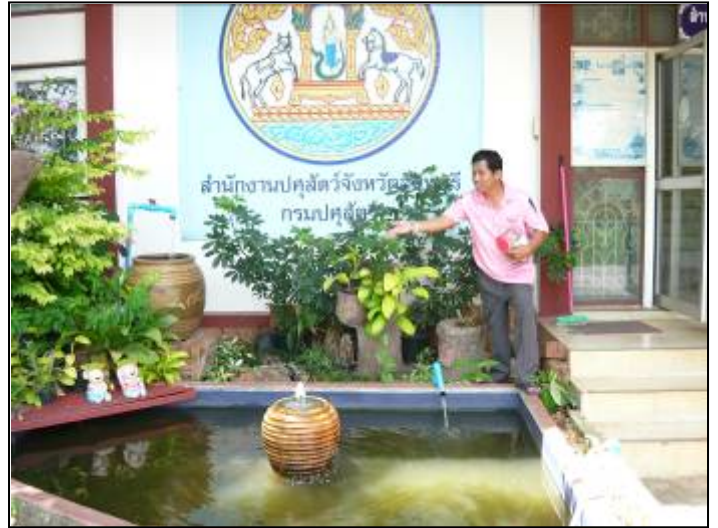
มีการให้อาหารปลาเพื่อให้เกิดความเพลิดเพลิน