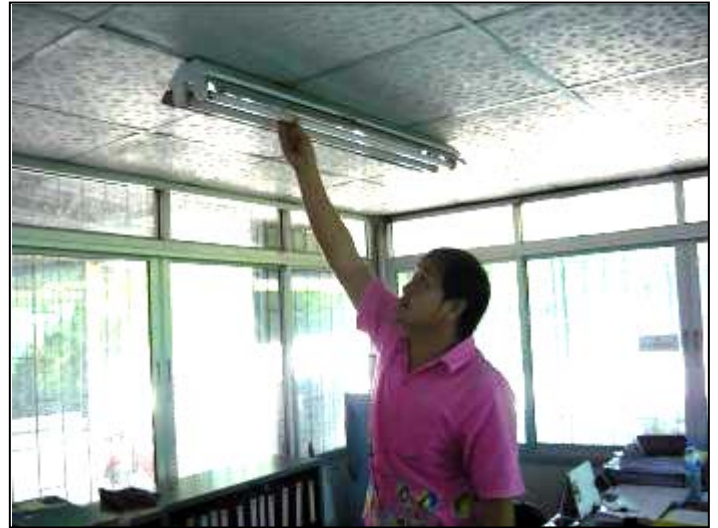
ตรวจสอบอุปกรณ์และซ่อมแซมอุปกรณ์คอมพิวเตอร์ ตรวจสอบหลอดไฟให้ใช้งานได้ และให้แสงสว่างที่เพียงพอ